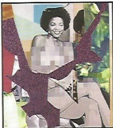
Mickalene Thomas, October 1977, 2019.

tement de l'esthétique afro-américaine des années 1960 et 1970, lesquelles ont connu de réelles avancées pour les Noirs et les femmes. Si les sujets de sa nouvelle série sont toujours des femmes afro-américaines, l'esthétique qui leur est appliquée relève moins fortement de la culture «black», et elle va beaucoup plus loin dans le syncrétisme que dans les précé-