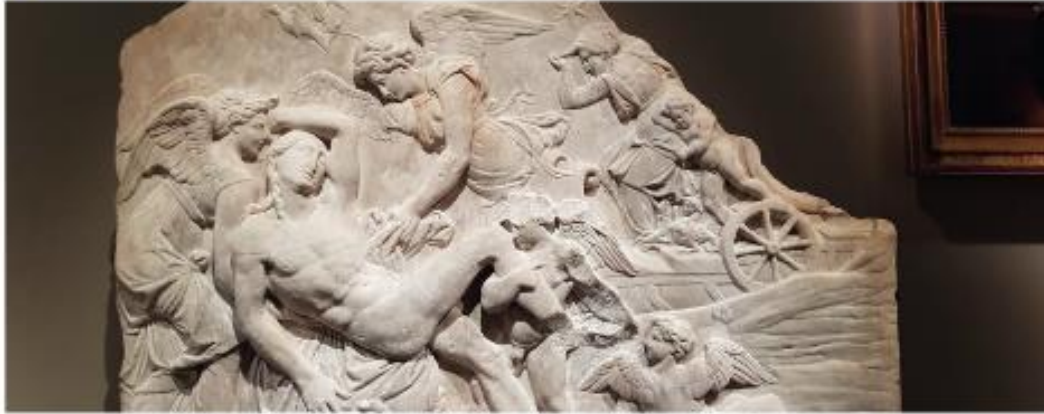
Bas-relief en marbre Mort d'Adonis réalisée vers 1550 sous la direction du Primatice. Galerie Ambroselli.

Un décor façon ruines antiques signé Jacques Garcia pour accueillir les visiteurs, des allées et des stands plus spacieux, une moquette épaisse, et un deuxième hall pour accueillir davantage de galeries : Fine Arts Paris s'étoffe et soigne sa présentation. Le salon a ouvert vendredi ses portes au Carrousel du Louvre avec 55 exposants, 16 de plus qu'en 2019. S'il évolue en accueillant un éventail plus large de domaines, avec des spécialistes en joaillerie ou un marchand d'arts premiers, sa charpente reste les beaux-arts, en visant musées et amateurs pointus. « Les marchands ne montrent pas tout sur le stand, ils ont des affaires en cours, des œuvres en restauration. Ce salon est une occasion d'échanger avec eux à un très haut niveau, sélectif », confie Vincent Delieuvain, conservateur des peintures italiennes du XVI e siècle au musée du Louvre, croisé dans les allées. Et d'ajouter : « selon toute logique, plus on remonte dans le temps, moins il y a de chefs-d'œuvre à vendre. Toutefois, beaucoup de marchands montrent ici des choses qu'ils n'exposent pas sur d'autres salons ».