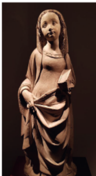
Vierge de l'Annonciation, vers 1500. Galerie Sisism.

enchères, le couple de Japonais en bronze doré et argenté d'Émile-Coriolan Hippolyte Guillemin réalisé en 1875 avec la maison Christoffe et montré à l'Exposition universelle de Paris en 1878 étincelle sur le stand de Steinitz, à 850 000 euros la paire, tout près d'une étonnante sirène berlinoise des années 1830 en « zink guss » dans le goût de Schinkel, qui ornait peut-être une fontaine et porte ce qui ressemble à des impacts de balles. Sur son très beau stand dévolu à la sculpture animalière du XX e siècle, Xavier Eeckhout présente un exceptionnel lévrier Art déco de Gaston-Étienne Le Bourgeois réalisé en bronze à partir d'un modèle en bois en non en plâtre, d'où le travail à la gouge sur la terrasse, pour 70 000 euros.