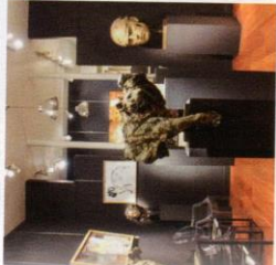
Exposition Christophe Charbonnel - Patrick Villas