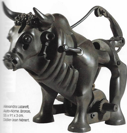
Alexandra Lazareff, Auto-Norme. Bronze, 55 x 91 x 3 cm. Didier-Jean Nénert.