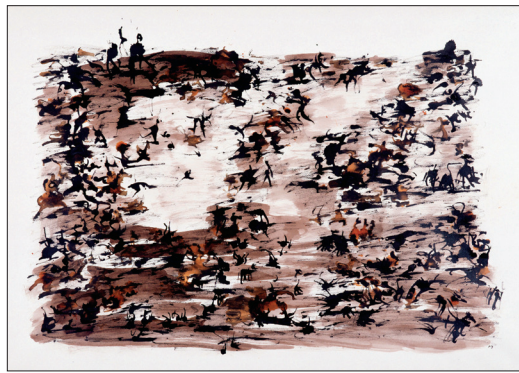
HENRI MICHAUX (1899-1984), SANS TITRE, 1956, ENCRE DE CHINE, 74 X 104 CM, COLLECTION DU MUSÉE DE L'HOSPICE SAINT-ROCH, ISSOUDUN.